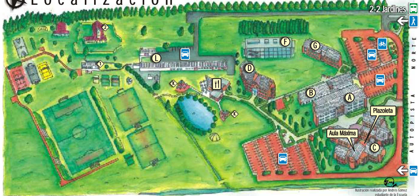
Ilustración realizada por Andrés Gómez estudiante de la Escuela